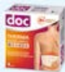
doc THERMA WÄRME- GÜRTEL RÜCKEN PZN: 18017142