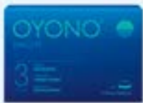
OYONO® NACHT PZN: 16931522