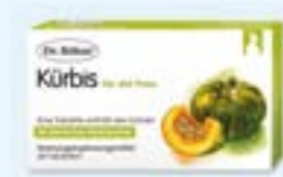
Dr. Böhm® Kürbis für die Frau PZN: 15390969