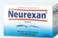
Neurexan® PZN: 04143009