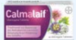
Calmalaif® PZN: 16808052