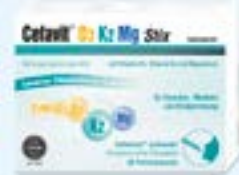
Cefavit® D3 K2 Mg Stix PZN: 16333287