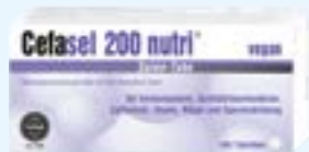
Cefasel 200 nutri® PZN: 02330807