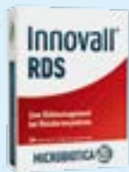
Innovall® RDS PZN: 12428051