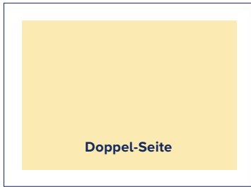
S.: 316 × 186 A.: 340 × 225