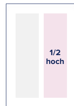
S.: B 88 mm x H 256 mm A.: B 101 mm x H 280 mm