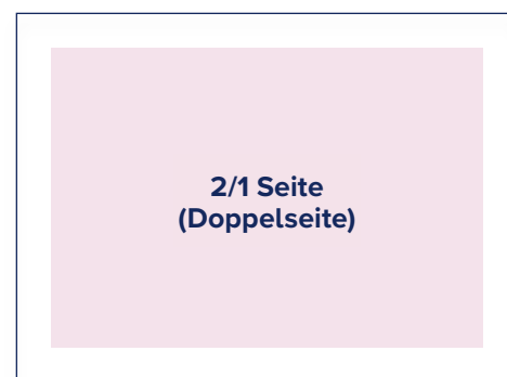
S.: B 394 mm x H 256 mm A.: B 420 mm x H 280 mm