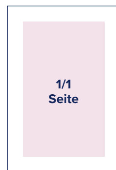
S.: B 184 mm x H 256 mm A.: B 210 mm x H 280 mm