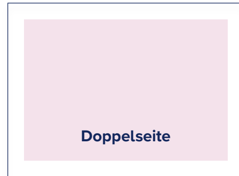
S.: 394 × 256 A.: 420 × 280