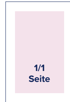
S.: 184 × 256 A.: 210 × 280