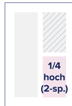
S.: 88 × 124

S. = Satzspiegel-Format A. = Angeschnittene Anzeigen Angaben in Millimetern (Breite × Höhe)