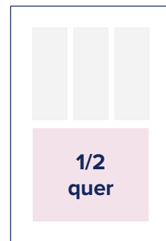
S.: 184 × 124 A.: 210 × 136