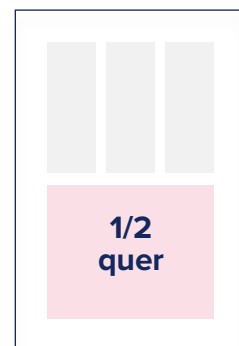
S.: 184 × 124 A.: 210 × 136