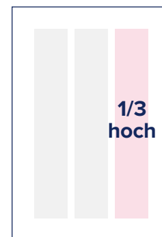
S.: 56 × 256 A.: 69 × 280