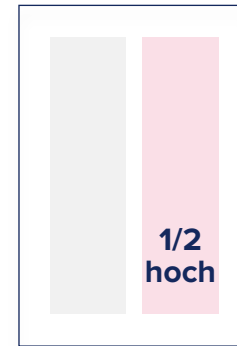
S.: 88 × 256 A.: 101 × 280