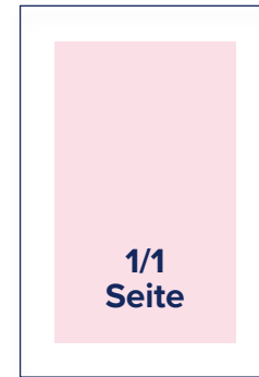
S.: 184 × 256 A.: 210 × 280