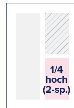
S.: 88 × 124

S. = Satzspiegel-Format A. = Angeschnittene Anzeigen