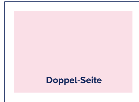
S.: 394 × 256 A.: 420 × 280